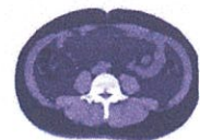
▲当院ファットスキャン画像

日本のメタボリックシンドロームの診断基準によると、「内臓脂肪型肥満は…できれば腹部CT撮影等により内臓脂肪面積を精密に測定することが好ましい」となっています。内臓脂肪の付き方は個人差が大きく、腹囲から正確に推定することは極めて難しいのです。